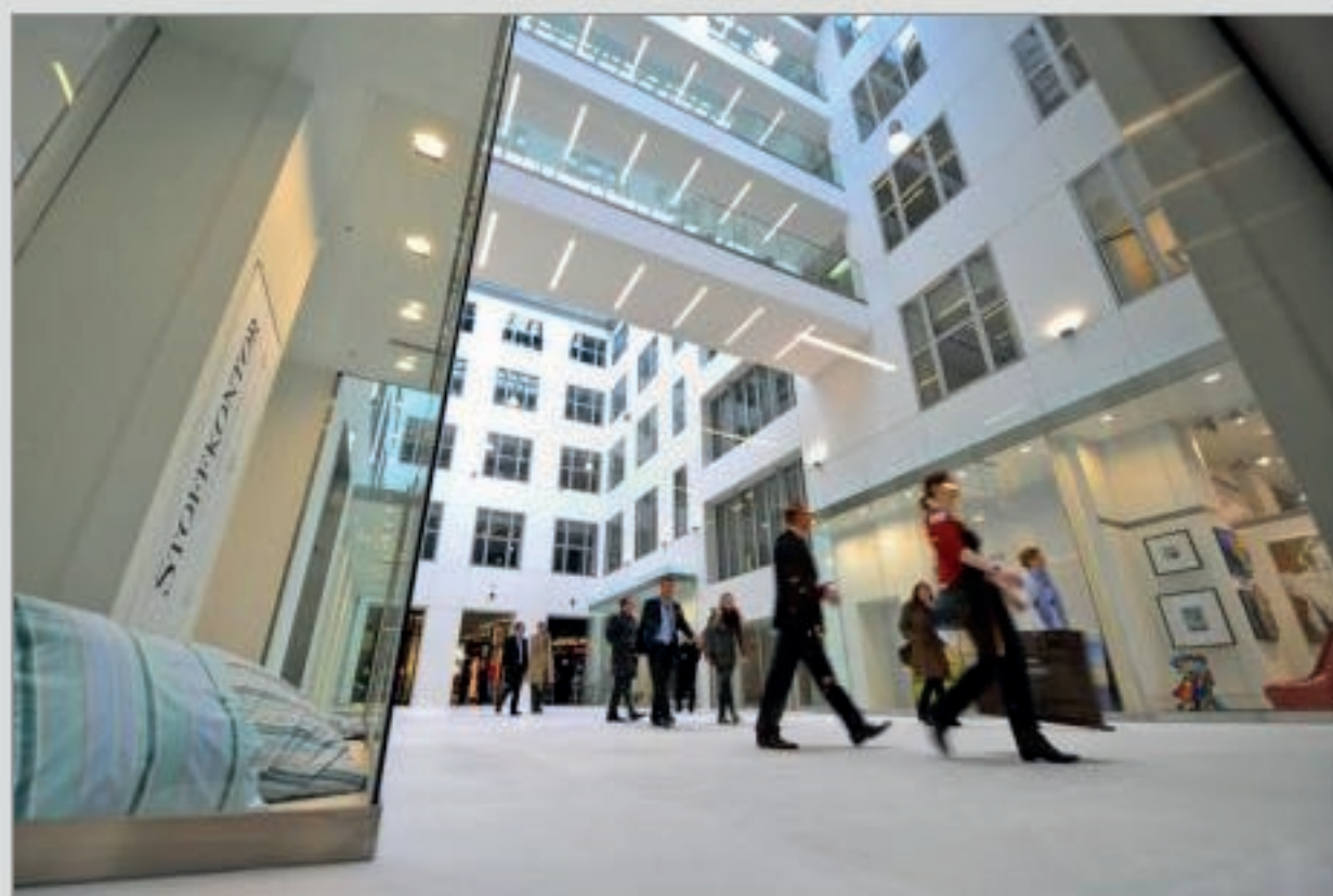
Das Kaufmannshaus Hamburg

Das renovierte Kaufmannshaus ist seit Freitag wieder geöffnet. Kaisergalerie im ehemaligen Ohnsorg-Theater und Alte Post sollen bald folgen.